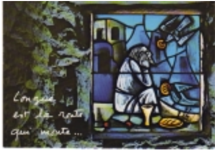
1 Kg 17,6